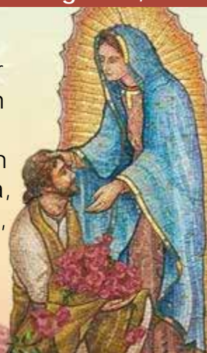
Illustration: Created by Peter Liturgical Design Studios for the Diocese of Fargo. Background: iStock.com/kylibyergeter. Photos used with permission. Copyright © 2018 USCCB, Washington, DC. All rights reserved.

Nuestra parroquia de Inmaculado Corazón de María, queriendo responder al imperante llamado que Nuestro Señor Jesucristo nos hace de defender la vida desde su concepción hasta la muerte natural, les hace una cordial invitación de formar parte del grupo parroquial de PRO-VIDA. Quienes estén interesados en trabajar en esta noble causa social de la Iglesia, pueden pasar o llamar a la oficina parroquial en horas hábiles, y preguntar por el Padre Armando. Él les dará más información.